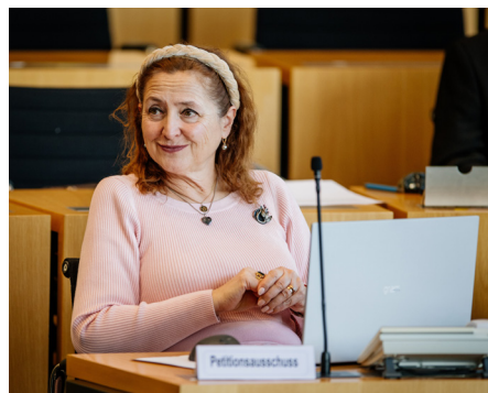
Abgeordnete Corinna Herold (AfD)

Bei der abschließenden Beratung der Petition stellte der Petitionsausschuss fest, dass diverse tatsächliche und rechtliche Aspekte vor einer Einführung einer Popularklage zum ThürVerfGH zu bedenken wären bzw. gegen eine solche Einführung sprechen. Um das Petikum gleichwohl in die politische Debatte einzubringen, hat der Petitionsausschuss beschlossen, die Petition den Fraktionen sowie der Parlamentarischen Gruppe des Thüringer Landtags zur Kenntnis zu geben. Die Fraktionen werden damit in die Lage versetzt, das Anliegen ggf. mit entsprechenden politischen Initiativen aufzugreifen.