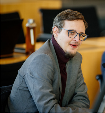
Abgeordneter Philipp Weltzien (Die Linke)

auf den Besuch einer allgemeinbildenden Schule, entfallen. Der Besuch einer Schule außerhalb Thüringens zur Erfüllung der Vollzeitschulpflicht ist dem zuständigen Schulamt nachzuweisen. Für die Erfüllung der Berufsschulpflicht gilt § 15 Abs. 3 ThürSchulG entsprechend.