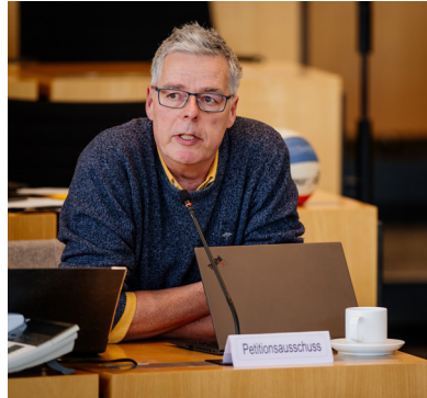
Abgeordneter Olaf Müller (Bündnis 90/Die Grünen)

ist. Der Petitionsausschuss hofft, dass die Stadt zukünftig weiterhin an einem gerechten Austausch der Interessen arbeitet. Dabei sollten aus Sicht des Petitionsausschusses nach Möglichkeit auch weitere Initiativen der kommunalen Wohnungsbaugesellschaft für ein vielfältiges Spielplatzangebot geprüft werden. Im Übrigen konstatierte der Petitionsausschuss jedoch, dass die grundsätzliche Ausgestaltung des kritisierten Spielplatzes rechtlich nicht zu beanstanden ist. Dies gilt insbesondere auch für die üblichen Nutzungen durch spielende Kinder. Kinderlärm ist grundsätzlich hinzunehmen und kann als Argument für eine Schließung des Spielplatzes nicht herangezogen werden.