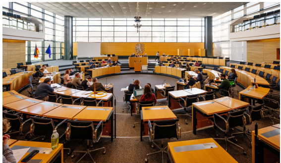
Sitzung des Petitionsausschusses im Plenarsaal

In der abschließenden Beratung beschloss der Petitionsausschuss aufgrund der Empfehlung des mitberatenden Fachausschusses, die Petition den Fraktionen sowie der Parlamentarischen Gruppe des Landtags zur Kenntnis zu geben. So können diese ggf. das Anliegen nochmals aufgreifen und entsprechende parlamentarische Initiativen ergreifen.